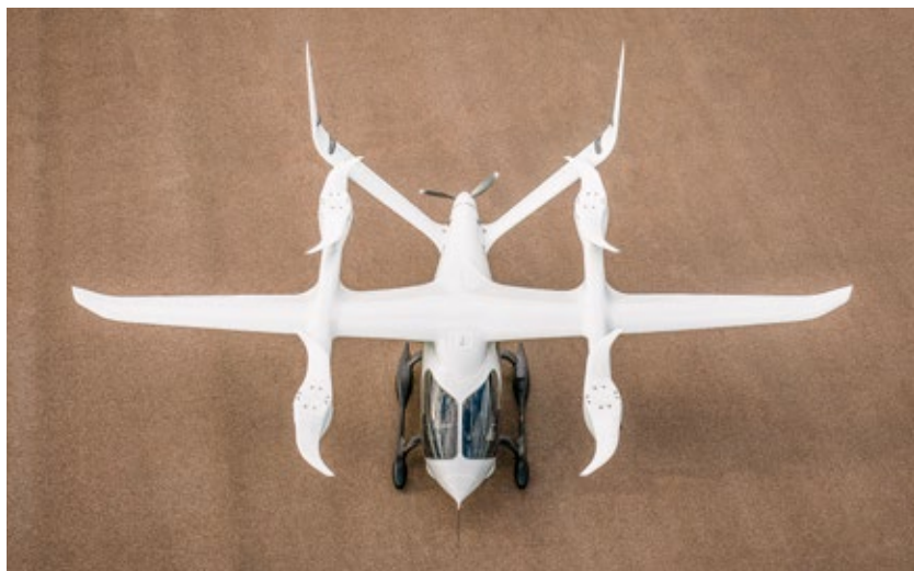
Figura 7 | Beta Technologies – Alia 250

Fonte: BETA Technologies, CC BY-SA 3.0, via Wikimedia Commons. Dispon  vel em: https://commons.wikimedia.org/wiki/File:BETA_Technologies_ALIA_250.jpg#file .