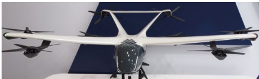
Figura 8 | Airbus – CityAirbus NextGen