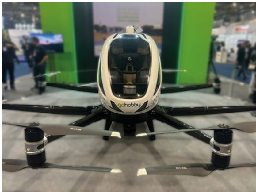
Figura 4 | EHang – 216S

Fonte: Arquivo pessoal de Marcos Henrique Figueiredo Vital. S o Paulo, 2025.