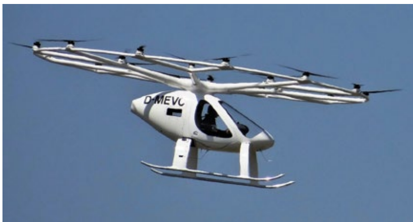
Figura 5 | Volocopter – Volocity