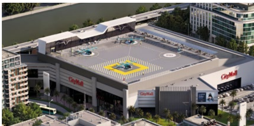
Figura 1 | Pousos e decolagens do topo de edif  cios