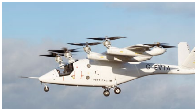
Figura 10 | Vertical Aerospace – VX4

Fonte: Acervo Vertical Aerospace. Dispon  vel em: https://drive.google.com/drive/folders/181dsRNvtLfHWezGv6Ywar-UoWuigjfMy .