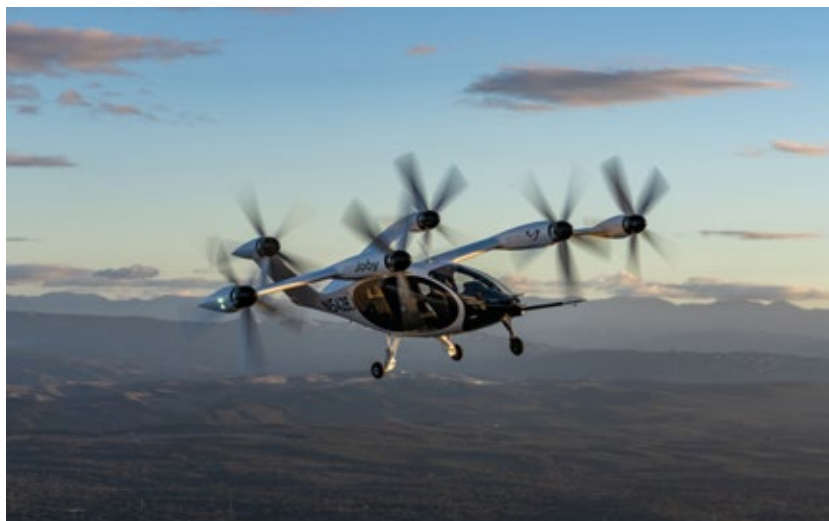
Figura 9 | Joby Aviation – S4

Fonte: Acervo Joby Aviation. (c) Joby Aero, Inc. Dispon  vel em: https://drive.google.com/drive/folders/1epAWlpwQiJJL_jOEDIMbWnET8b878Dj .