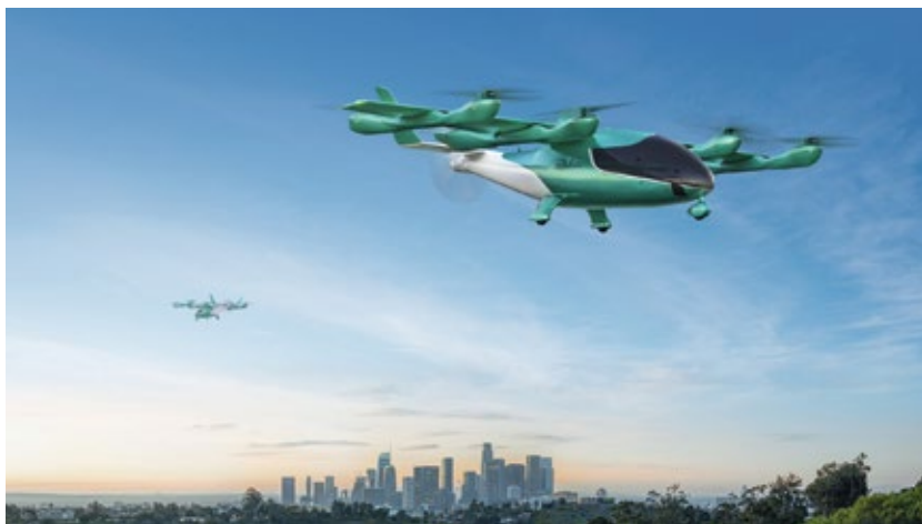
Figura 6 | Eve Air Mobility – Eve-100